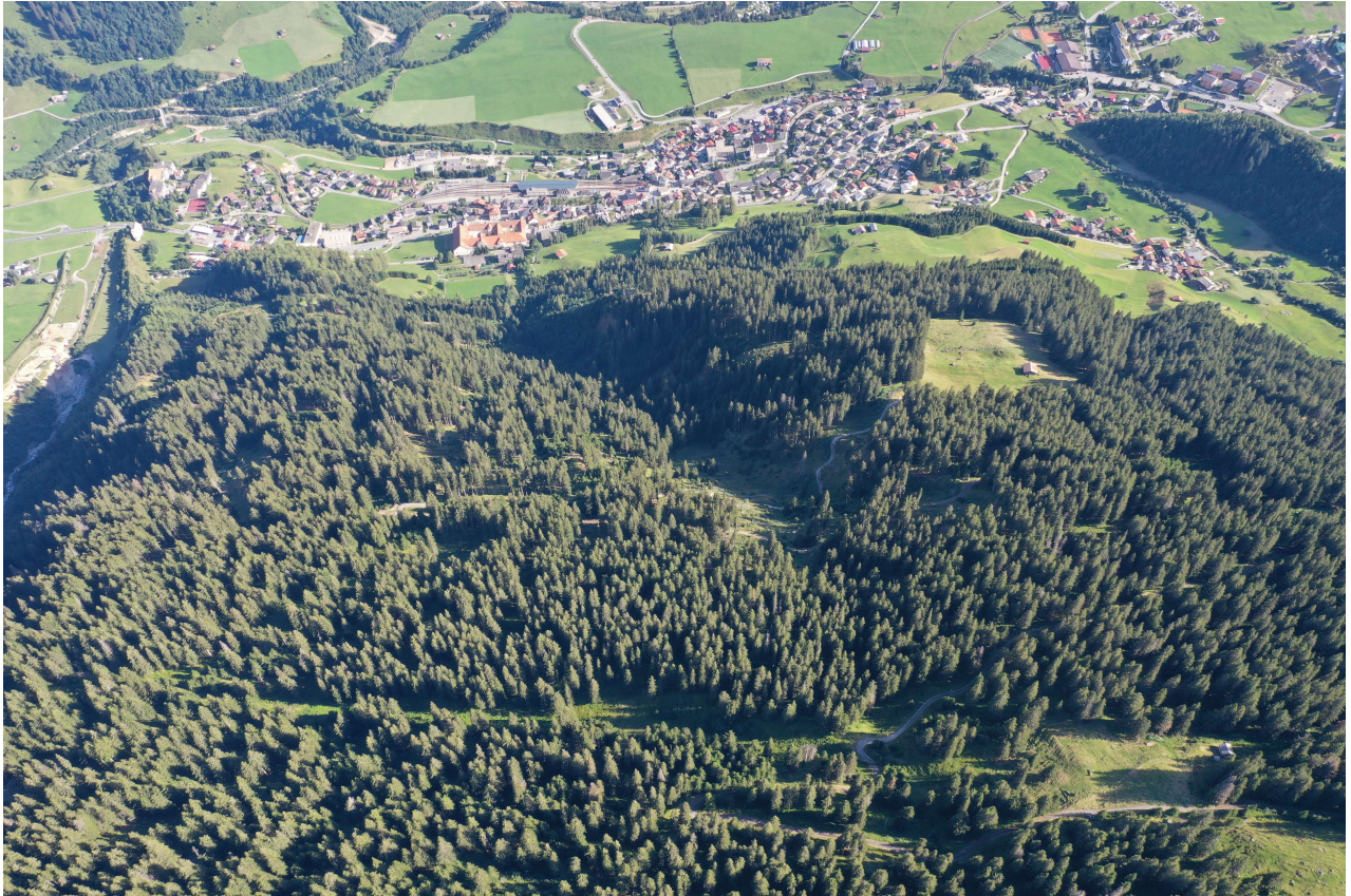
Uaul Run che protegia la pli gronda part da habitadis, colligaziuns da traffic e la Claustra, valeta dallas immobilias segiradas tier la segirada d'edificis da varga 1 milliarda francs!