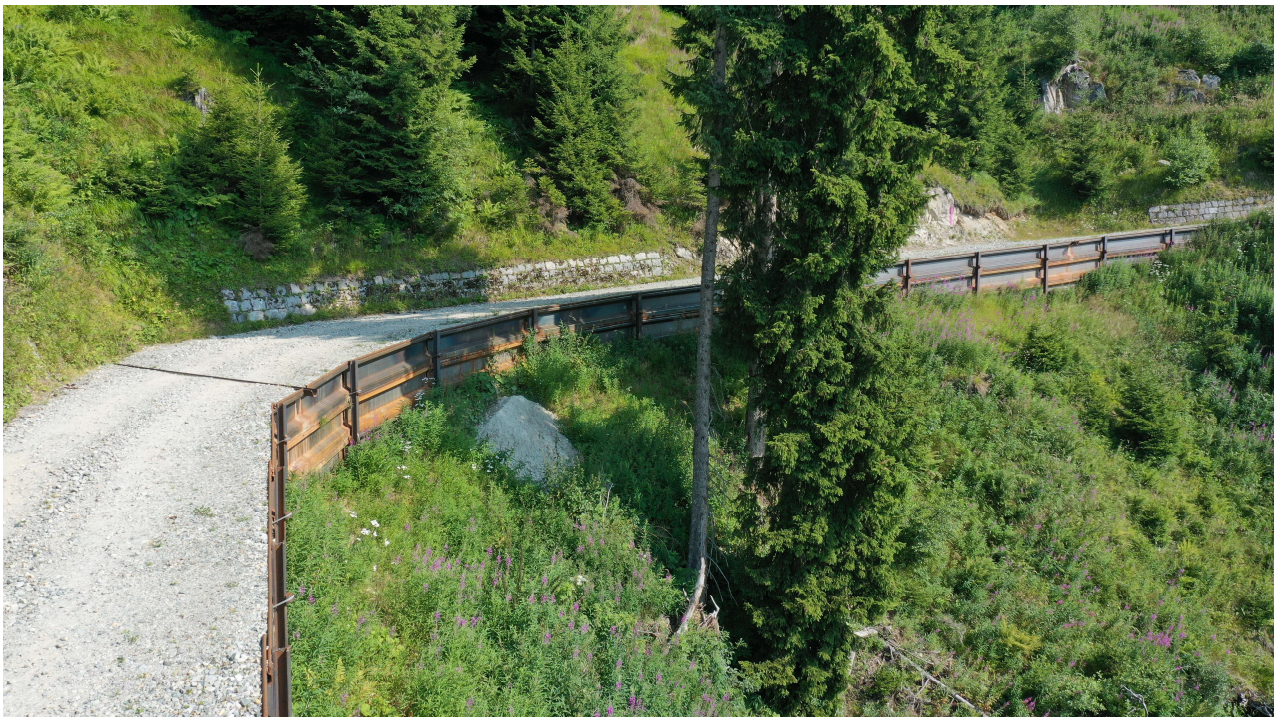
Tschancun Val Mala cun preits da spundas, errigidas suenter ils donns da malauras digl october 2020. Aschia se presentass la via errigida era sils ulteriurs tschancuns, fotografau 1 onn suenter la construcziun.