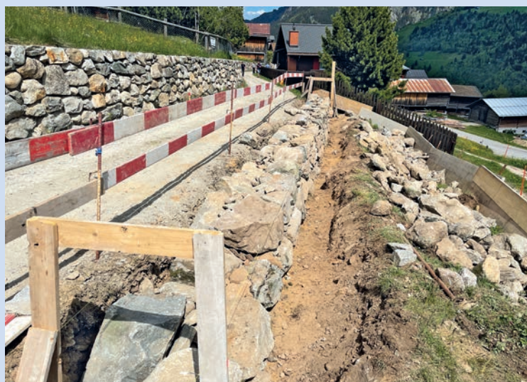
Via Bugnei 2021.