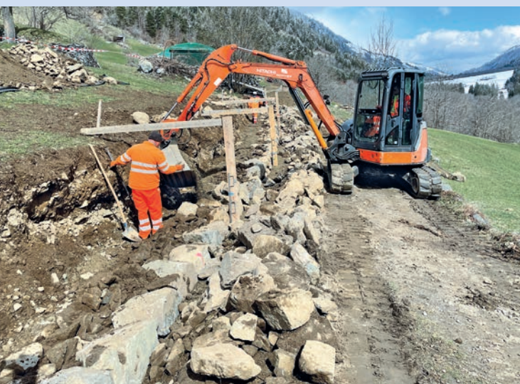
Via Narliun – mirs schetgs en construcziun.