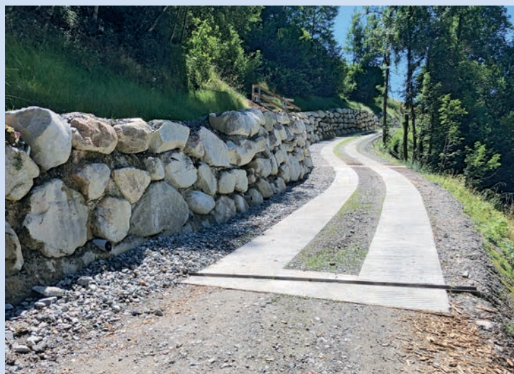
Via Quadras finida.