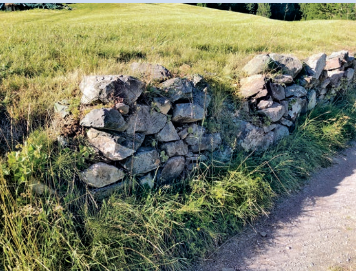
Via Narliun – mirs schetgs avon la realisaziun dil project.