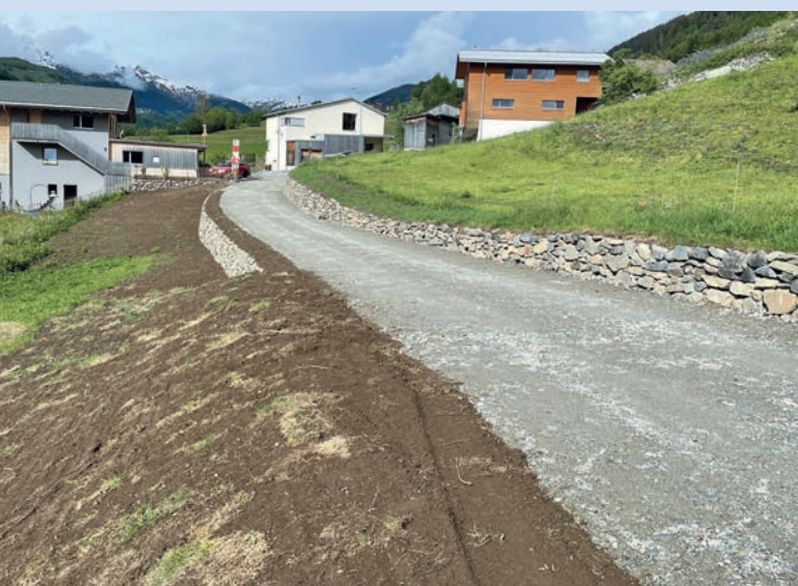
Via Narliun – suenter la realisaziun dil project.

Singulas protestas ein sinaquei vegnidas retratgas. Per las autras ei la decisiun curdada entras il departament per economia publica e fatgs socials. Encunter neginas decisiuns dil departament ei vegniu recurii tier la Dertgira administrativa dil cantun Grischun.