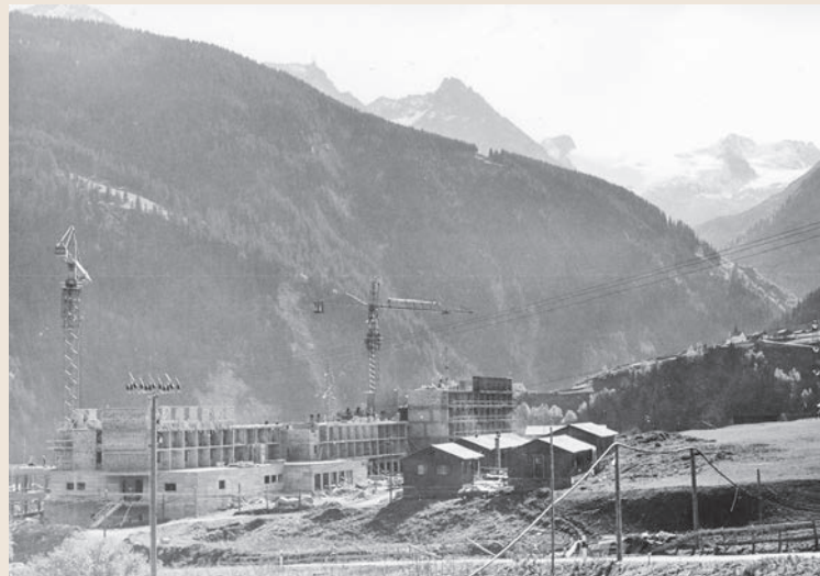
In'emprema part dil hotel ei construida.