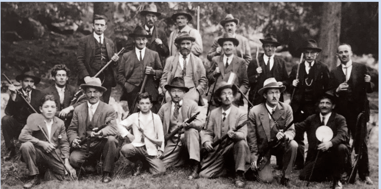
Igl onn 1931 a Fontanivas – sentupada al tir intern.