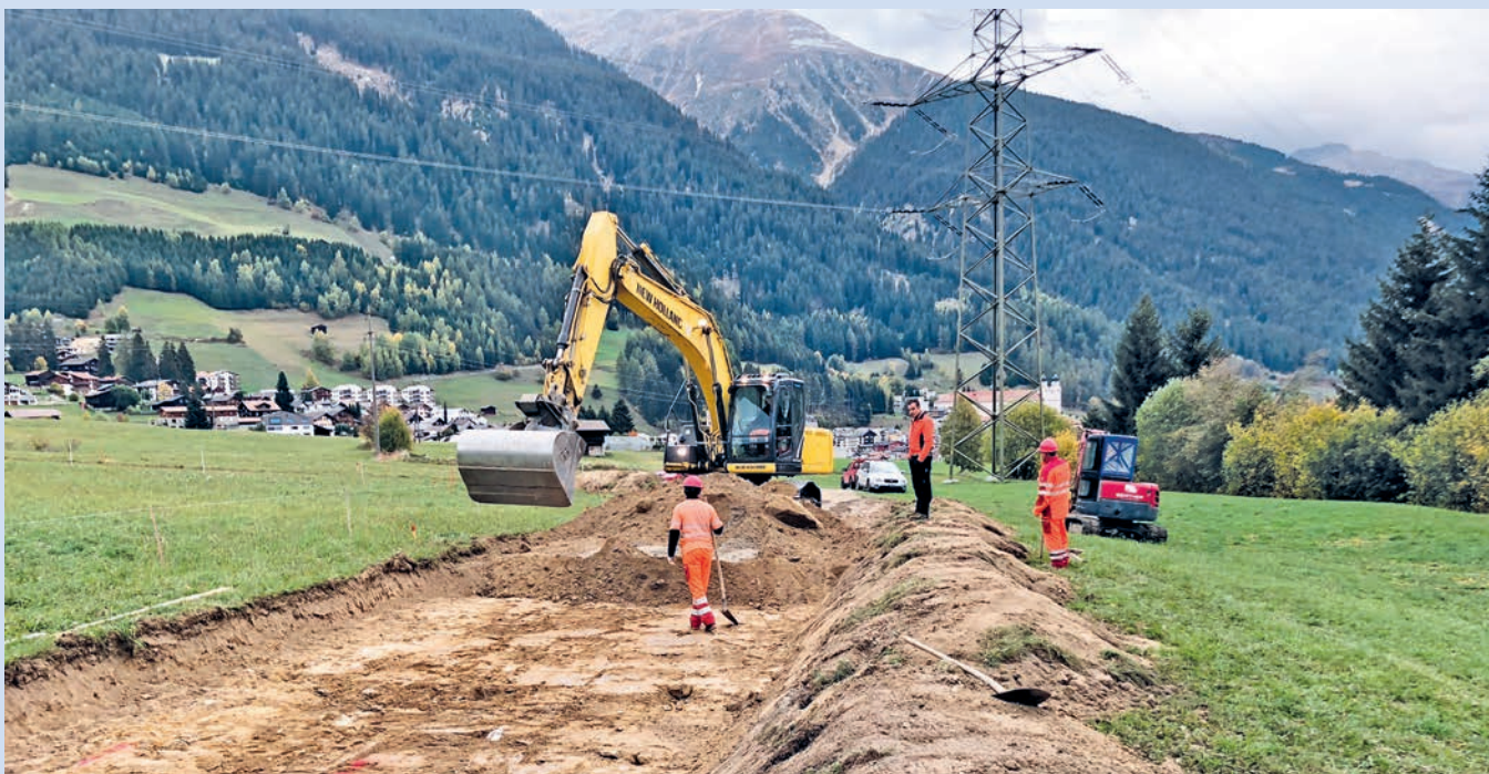
Via Sontga Gada en construcziun.

Il project general dalla meglieraziun da Mustér ei vegnius elavoraus dil biro Cavigelli inschigniers e la part ecologica entras il biro Atragene da Cuera. Naven dils 11 da settember entochen ils 12 d'october 2015 ha giu liug l'exposiziun publica dil project general. En pliras seras d'orientaziun ei vegniu informau en detagl sur dil project. Encunter il project general d'exposiziun ein 35 protestas vegnidas inoltradas. La primavera 2016 ha il departament per economia publica e fatgs socials organisau in'uatga cun mintga protestader ensemen culla cumissiun da meglieraziun.