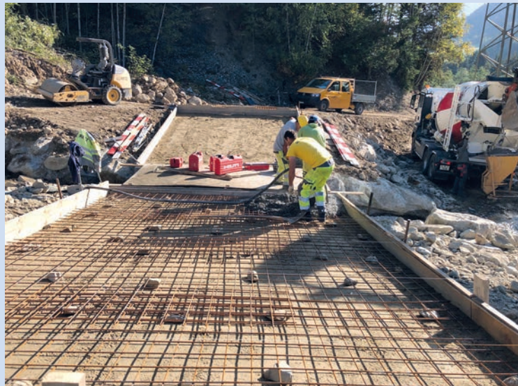
Via Casarsa traversada Ual Lumpegna.